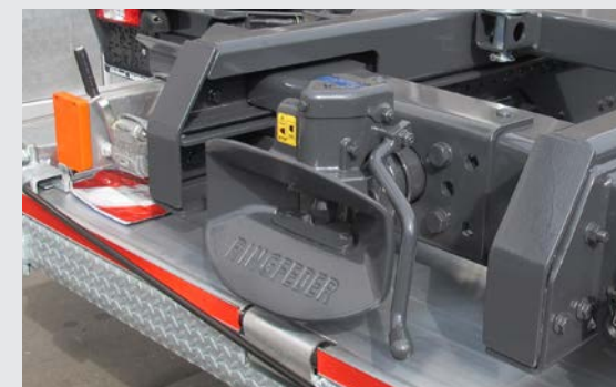
Normalkupplung für Drehschemelanhänger