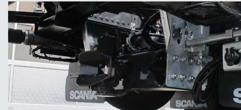
Tiefkupplung für Tandemanhänger