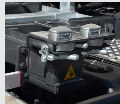
Leichtgängige Liftadapter mit Doppeltwistlocks