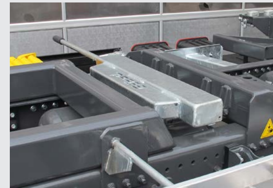
Mittenaufgabe bündig im Hilfsrahmen integriert