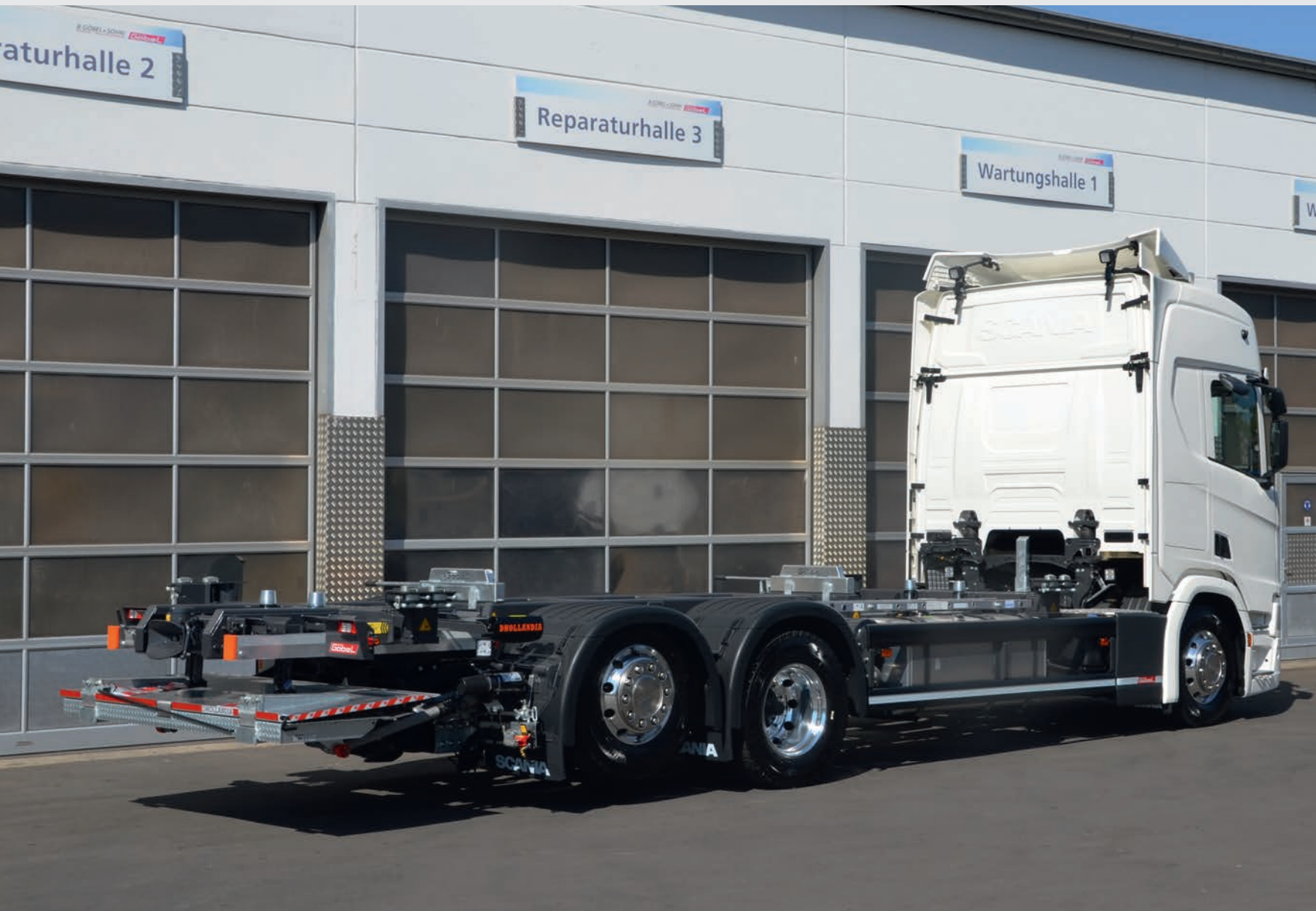
MECHANIKLIFTER 565 LiLT mit Ladebordwand und Tiefkupplung