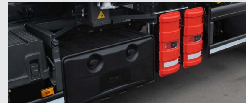
Optional: Werkzeugkasten und Feuerlöscher

Darf es noch ein wenig mehr sein? Unser umfangreiches Zubehörprogramm läßt keine Wünsche offen.